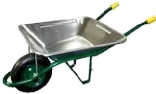
CARRETILLA AGRICOLA GAL. COB009