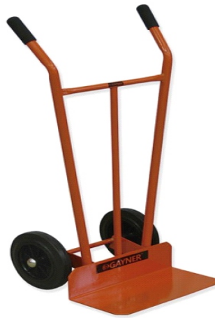
HIERRO 300KG 73-474 R/MACIZA GAY051