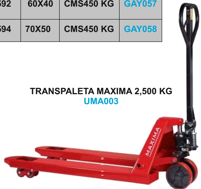
TRANSPALETA MAXIMA 2,500 KG UMA003