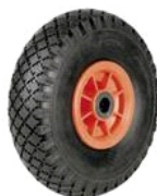
RUEDA LL/PLASTICO NEUMATICA KAR054 MACIZA GAY017