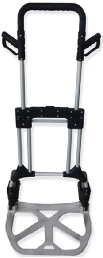
ALUMINIO 200KG 73-348 R/GOMAPLEGADA 90MM GAY055