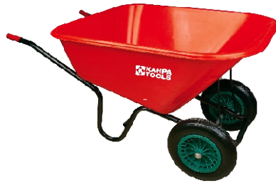
CARRETILLA NYLON 300LTS C/2 RUEDAS COB021