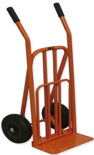
HIERRO 250KG PALA ABATIBLE 73-450 R/NEUMAT. GAY059 73-452 R/MACIZA GAY062