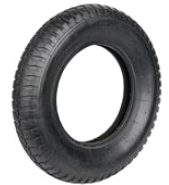
CUBIERTA CARRETILLA OBRA COB017