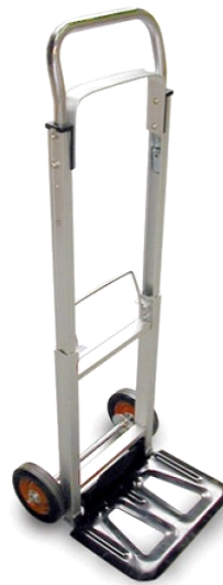
ALUM/CHAPA 90KG 73-360 R/GOMAPLEGABLE GAY036