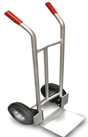
ALUMINIO 200KG 73-380 R/NEUMAT. GAY049