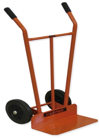
HIERRO 300KG 73-472 R/NEUMAT. GAY034