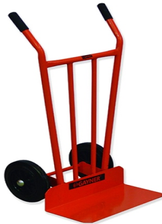
HIERRO 350KG 73-480 R/NEUMAT. GAY033