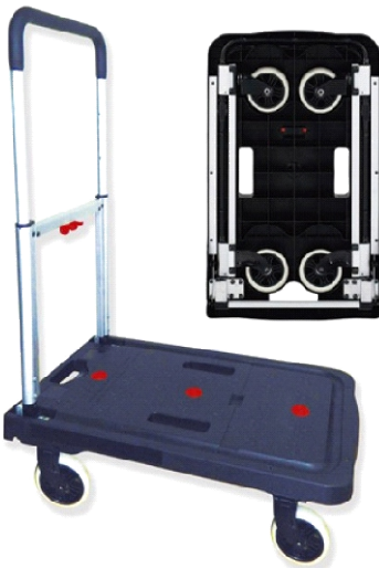
CARRO-PLATAFORMA PLEGABLE 73-572 120KG BASE 410X680MM GAY042