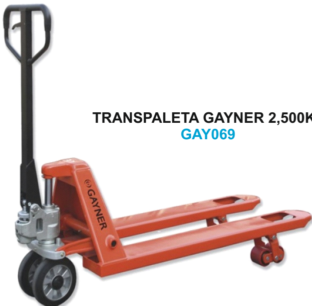
TRANSPALETA GAYNER 2,500KG GAY069