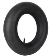
CAMARA CARRETILLA OBRA COB018