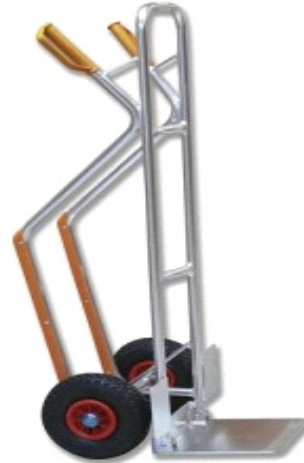
ALUMINIO 180KG 73-390 R/NEUMAT PALA ABATIBLE GAY101