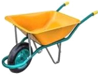
CARRETILLA OBRA R/NEUMA. 90LT COB003 THC002