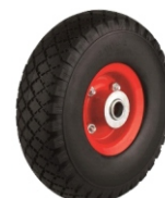
RUEDA LL/METAL NEUMATICA GAY015 MACIZA GAY004