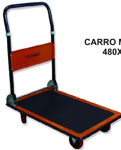
CARRO MANGO ABATIBLE 480X720MM73-550 150KG GAY038