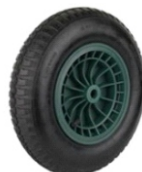
RUEDA CARRO NEUMATICA COB004

Alfesa Alfesa Alfesa Alfesa Alfesa Alfesa Alfesa