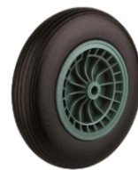
RUEDA CARRO MACIZA LL/PLAST Y METALICA KAR031