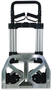
ALUMINIO 90KG 73-340 R/GOMAPLEGADA 55MM GAY100