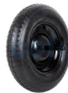
RUEDA OBRA NEUMATICA COB008