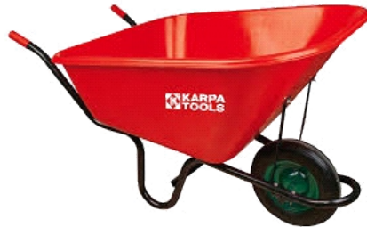
CARRETILLA NYLON 300 LTS 1RUEDA COB020