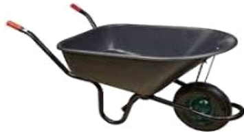
CARRETILLA NYLON 150 LTS NEGRA COB019