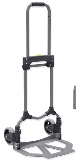
ALUMINIO 70KG 73-334 R/GOMAPLEGADA 55MM GAY052