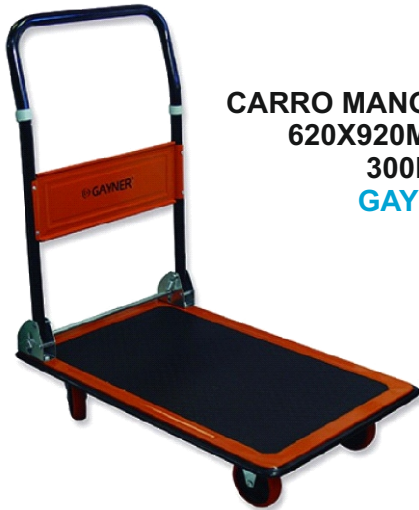
CARRO MANGO ABATIBLE 620X920MM73-560 300KG GAY024