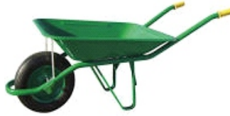
CARRETILLA OBRA VERDE R/NEUM. COB001 THC001