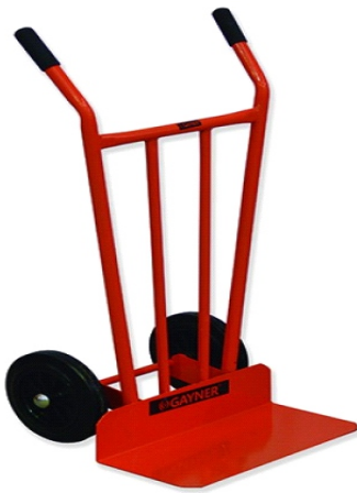
HIERRO 350KG 73-476 R/GOMA 260 GAY060