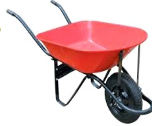
CARRETILLA OBRA ROJA R/NEUM COB002 THC003