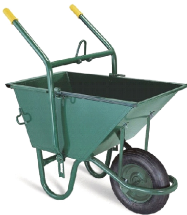
CARRO CHINO CSA003