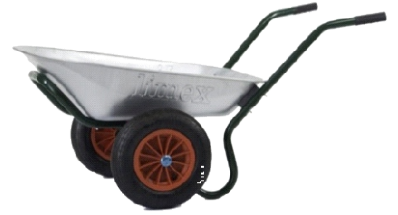
CARRETILLA 2 RUEDAS GALVA 90LTS COF053