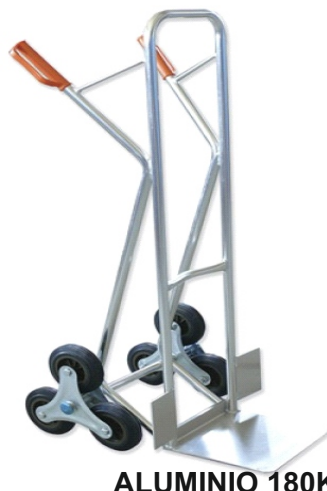
ALUMINIO 180KG 73-391 R/GOMASUBE-ESCALERAS GAY054